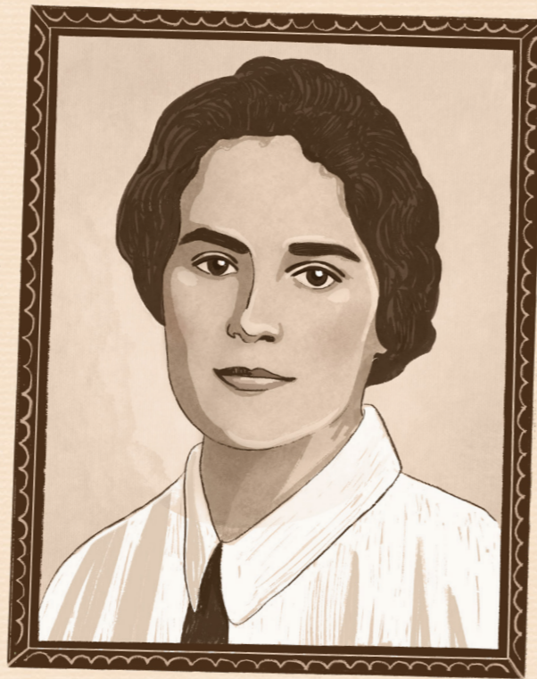
PROF. KAROLINA LANCKOROŃSKA

W tym roku obchodzimy 30. rocznicę przekazania wyjątkowej kolekcji malarstwa włoskiego przez Profesor Karolinę Lanckorońską . Obrazy z wystawy należały kiedyś właśnie do niej oraz do jej ojca Karola. Karolina Lanckorońska podarowała zebrane dzieła sztuki muzeom na całym świecie, między innymi Zamkowi Królewskiemu na Wawelu. A czy ty chciałbyś zostać kolekcjonerem? Może twój obraz mógłby znaleźć się w sławnej kolekcji?