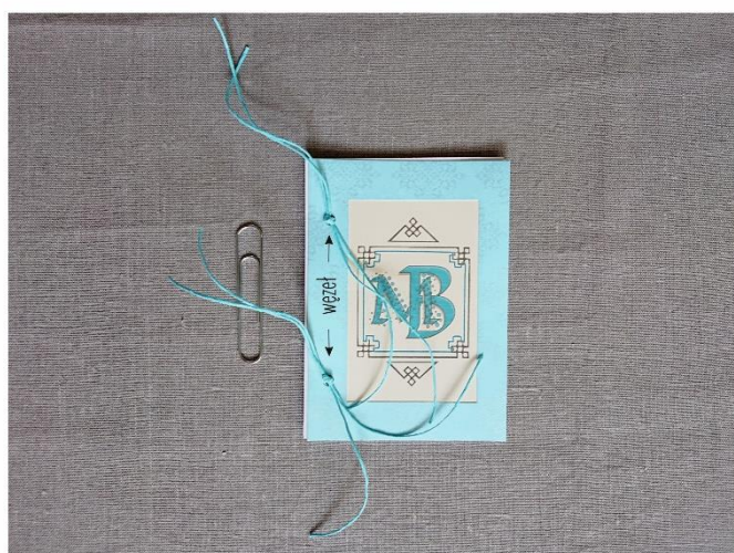
sznurki naciągamy, równamy i robimy podwójny węzeł

Kiedy mamy przeciągnięte przez wszystkie warstwy sznurki równamy je i robimy węzeł, przy każdej dziurce dwa razy.