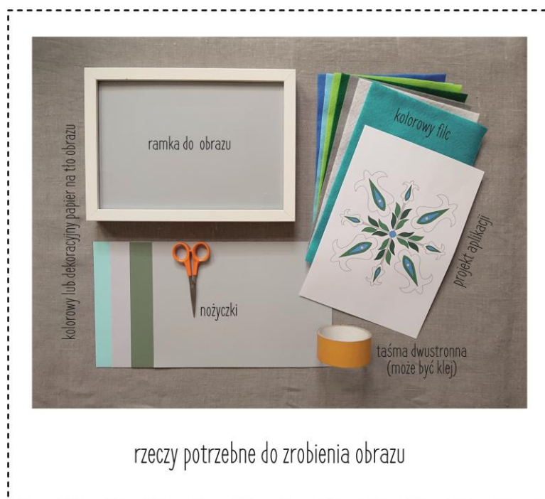
rzeczy potrzebne do zrobienia obrazu

Tematem warsztatów będzie zrobienie dekoracji w formie obrazu. Nie będziemy jednak malować w tradycyjny sposób. Barwne motywy wykonamy z tkanin. Przez chwilę popracujemy jak artyści, którzy dekorowali dla dostojników na Wschodzie piękne „ruchome” domy, czyli namioty.