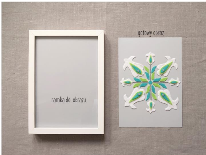
gotowy obraz „malowany” tkaniną opraw w ramkę

Kiedy wszystkie elementy przykleisz do tła, twój obraz będzie gotowy. Kolejny etap to włożenie swego dzieła do ramki.