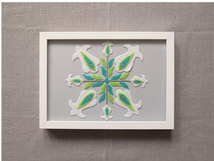
obraz „malowany” tkaniną gotowy

Kiedy obraz „malowany” tkaniną jest gotowy szukamy miejsca, gdzie możemy swoje dzieło zaprezentować.