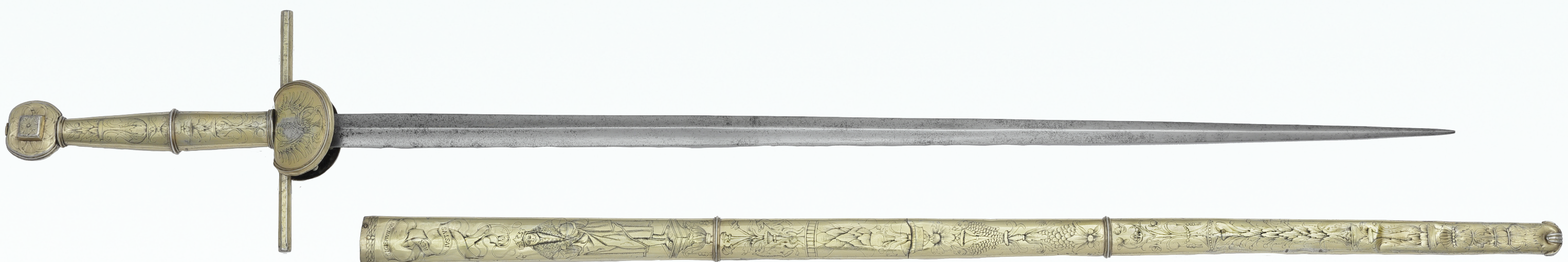
✦ MIECZ ZYGMUNTA STAREGO