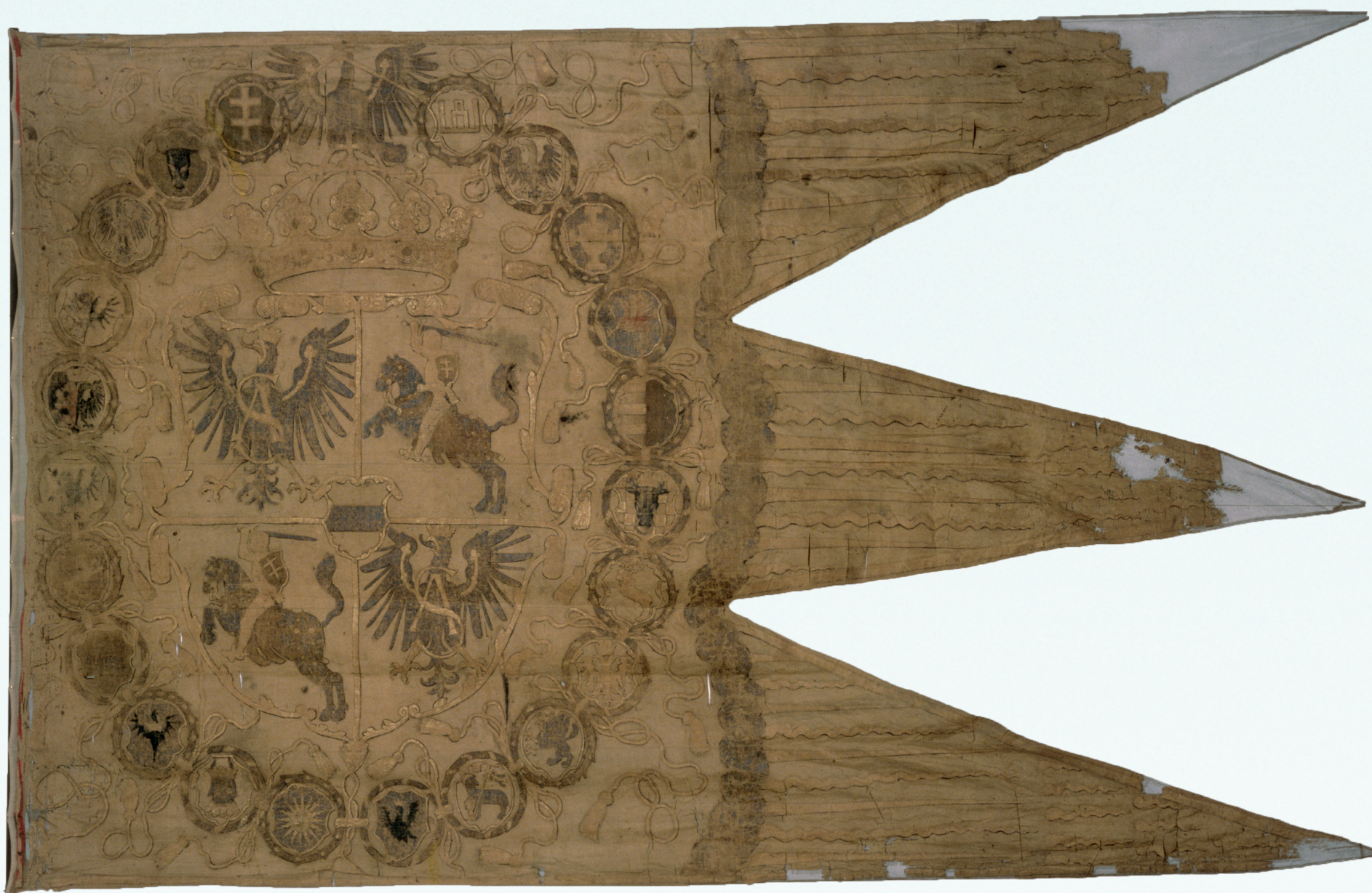
✦ CHORĄGIEW NADWORNA