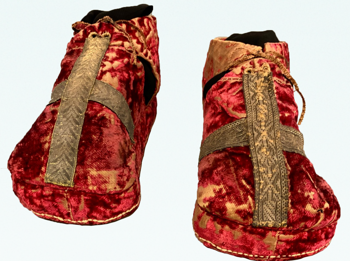
✦ SANDAŁY ZYGMUNTA AUGUSTA