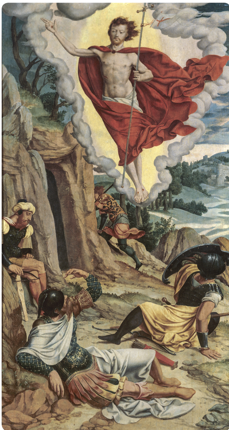
„Zmartwychwstanie Chrystusa” Bartholomaeus Bruyn st. (1493-1555)