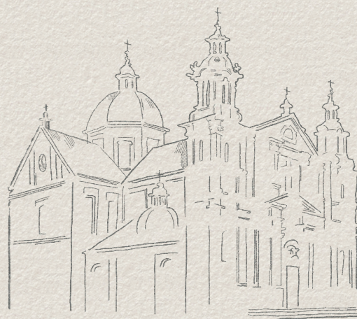
← Kościół św. Anny w Krakowie

Andrzej Radwański był artystą barokowym. Przez ponad 30 lat aktywności zawodowej tworzył monumentalne malowidła w najważniejszych krakowskich świątyniach – trzy z nich widać na rysunkach. Natomiast w czwartym poszukiwał inspiracji do swoich projektów, szkicując między innymi rzeźby Baltazara Fontany. Czy potrafisz wskazać, w którym kościele ukazanym na rysunku można dziś podziwiać zespół dzieł słynnego rzeźbiarza?