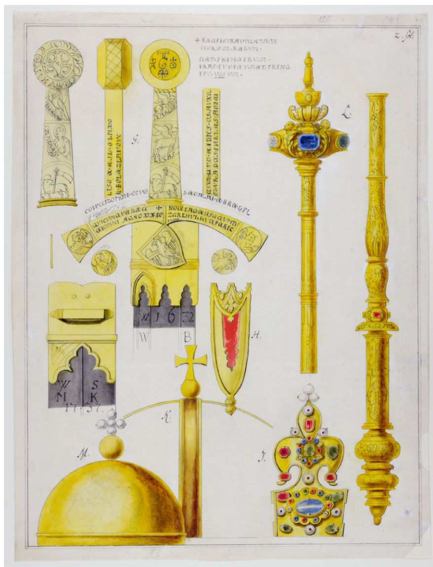
INSYGNIA KORONACYJNE rysunek rok 1764 Józef Krzysztof Werner Gabinet Rycin Biblioteki Uniwersyteckiej w Warszawie.