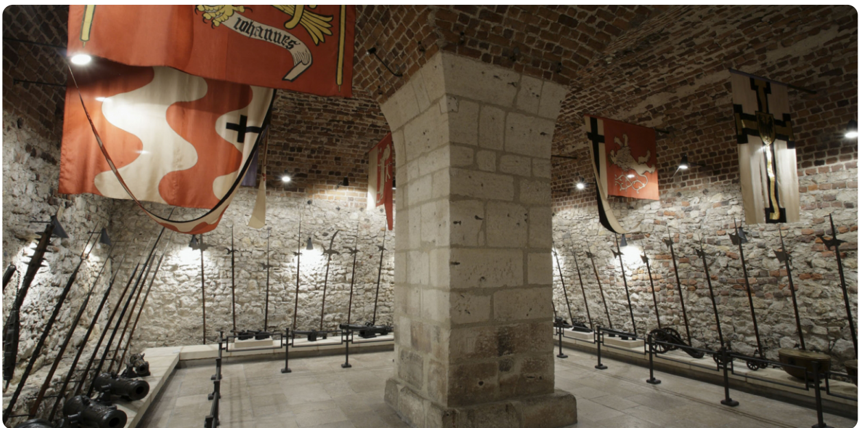
ZAMEK KRÓLEWSKI NA WAWELU - piwnica XIV wiek. Kopie chorągwi grunwaldzkich wg Długosza

Z czasem polscy władcy jak nakazywała wiara i tradycja przed ołtarzem patrona ojczyzny zanosili modlitwy o wstawiennictwo w bitwach a w podzięce za zwycięstwo składali trofea jako wotum. I tak zaczęła się tradycja, której początek dał król Władysław Łokietek. Nie zmieniło się to nawet wtedy, gdy królowie polscy rezydowali w Warszawie.