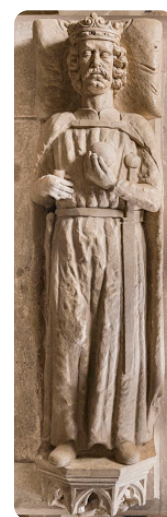
NAGROBEK KRÓLA POLSKI WŁADYSŁAWA ŁOKIETKA wapień pińczowski, ok. 1333 Katedra na Wawelu w Krakowie

Pomnik nagrobny Władysława Łokietka wykonany został z wapienia pińczowskiego. Był to okazały sarkofag, który składał się z tumbi i baldachimu. Na tumbie nagrobka zostali w naturalnych pozach przedstawieni płaczkowie, którzy swoimi gestami wyrażali smutek, rozpacz i ból po odejściu władcy. Postać króla została przedstawiona jako śpiąca, co miało symbolizować oczekiwanie na zmartwychwstanie. Baldachim, który nakrywał tumbę został wsparty na ośmiu wolnostojących i smukłych kolumnach. Jego zwieńczenie stanowiły strzeliste arkady zamknięte ostrym łukiem. Szczyty arkad wypełnione ślepymi maswerkami, wieńczyły kwiatony.