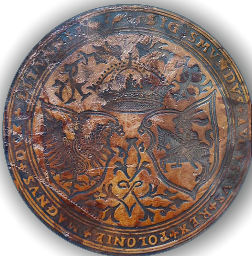
fragmenty oprawy księgi Zygmunta Augusta Primasii Utcensis 1560 Zamek Królewski na Wawelu