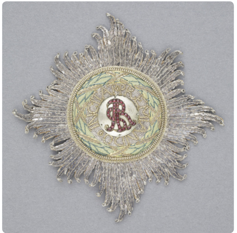
Gwiazda Orderu św. Stanisława