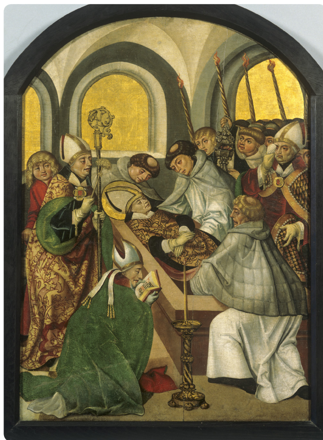
Legenda św. Stanisława – Ukaranie żon

Promotor – inicjator, zwolennik i opiekun jakiegoś przedsięwzięcia