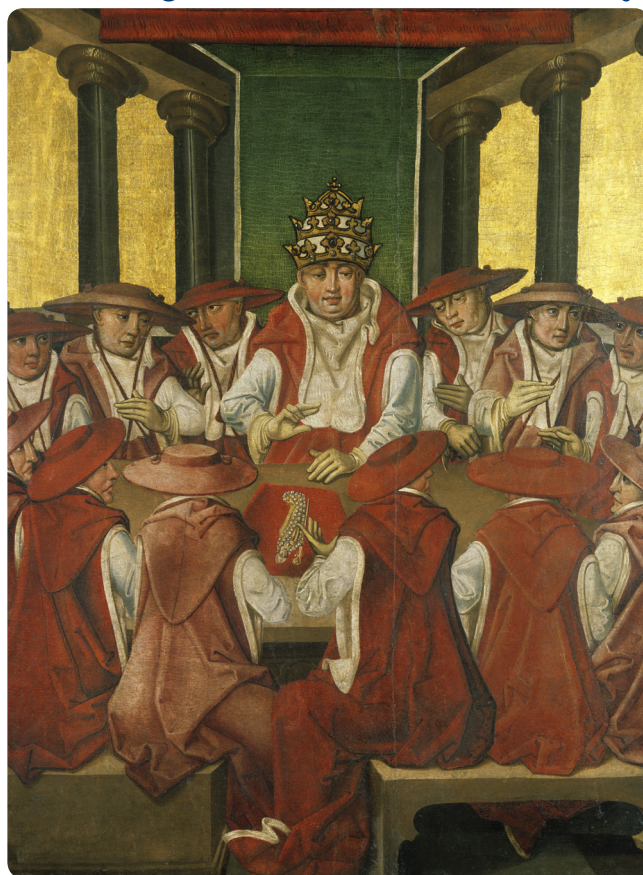
Legenda św. Stanisława - Kanonizacja

W późniejszym czasie w nawiązaniu do tego zwyczaju przyjął się publiczny, uroczysty akt ukazywania świętego, aktualnie wynoszonego na ołtarze.