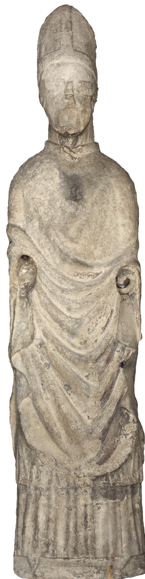
Posąg św. Stanisława

Opactwo w Tyńcu - najstarszy istniejący klasztor na ziemiach polskich o ogromnym dziedzictwie kulturowym. Ważne miejsce ze względu na imponujący zespół budynków klasztornych wraz z kościołem. W czasach św. Stanisława ośrodek życia intelektualnego oraz kultury duchowej i materialnej. To także miejsce, gdzie piękno liturgii uświetniały artystycznej klasy szaty i sprzęty, tkaniny oraz inne dzieła sztuki. Stanowiły one dopełnienie wraz z muzyką (chorałem gregoriańskim) misji powierzonej mnichom - pogłębiania dalszej chrystianizacji kraju. Benedyktyni byli również pionierami nowoczesnego rolnictwa i produkcji spożywczej oraz ziołolecznictwa.