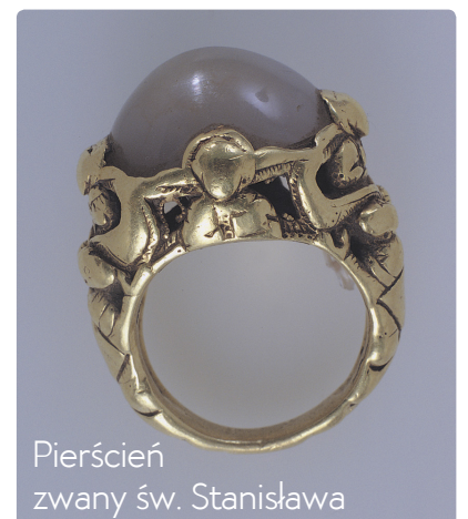
Pierścień zwany św. Stanisława

Leodium - łacińska nazwa miasta Liège w dzisiejszej Belgii nad rzeką Mozą.