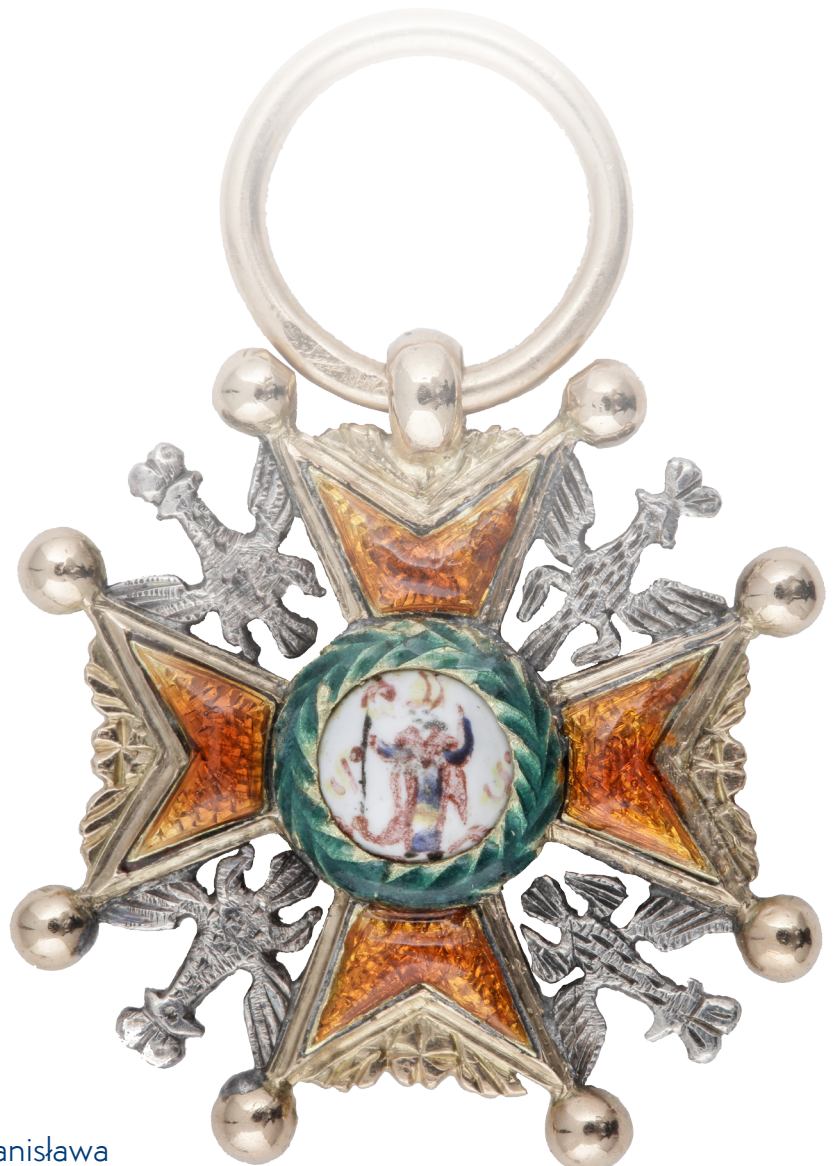
Order św. Stanisława