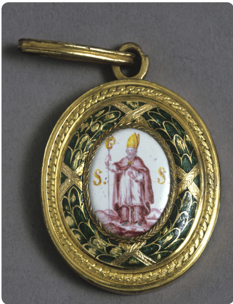
Odznaka Oficjum Kapituły Orderu św. Stanisława