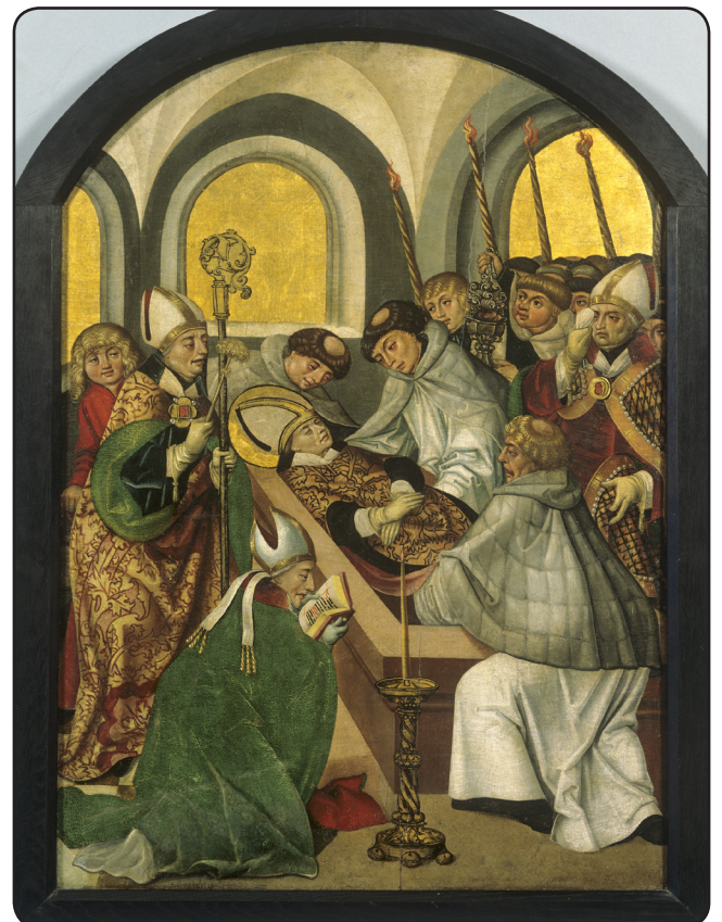
Legenda św. Stanisława - Złożenie zwłok św. Stanisława

Mediewista - historyk - badacz epoki średniowiecza.