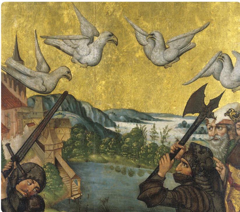
Legenda św. Stanisława - Rozsiekanie