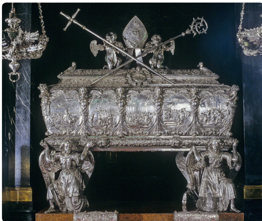
Trumna św. Stanisława

I choć nie znamy słów Świętego, to możemy się wsłuchać w głębię jego ducha, która niezmiennie motywuje ludzi do wielkiego, nadludzkiego dobra.