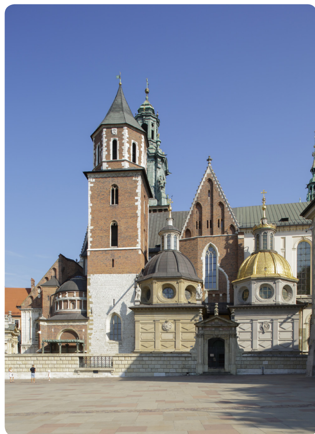
Katedra - elewacja zachodnia

Kanonizacja św. Stanisława miała przyczynić się w niedalekiej przyszłości do zjednoczenia Regni Poloniae i wzrostu poczucia jedności narodowej.