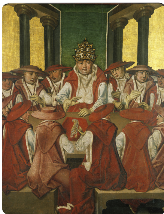
Legenda św. Stanisława - Kanonizacja

Szczepanów - wieś położona w Małopolsce, nieдалeko Bochni, miejsce urodzenia św. Stanisława