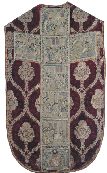
Ornat z daru Piotra Kmity

Opat - wyższy przełożony w katolickim zakonie męskim.