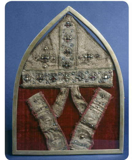
Infuła zwana św. Stanisława

Po jej ukończeniu Stanisław kontynuował studia w Leodium, gdzie Aaron wysyłał najzdolniejszych uczniów. Miasto to, było ważnym ośrodkiem intelektualnym, tamtejsza znana szkoła katedralna czasem nazywana była „Atenami Północy”. To tutaj młody człowiek jakim był Stanisław zdobył odpowiednie przygotowanie i wiedzę by później służyć Kościołowi i Królestwu Polskiemu. Wszedł w orbitę aktualnych wydarzeń i w świat ówczesnych europejskich elit.