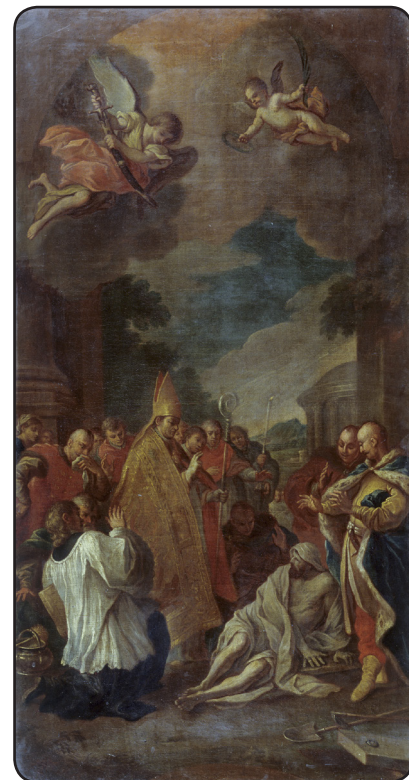
Szymon Czechowicz - Wskreszenie Piotrowina