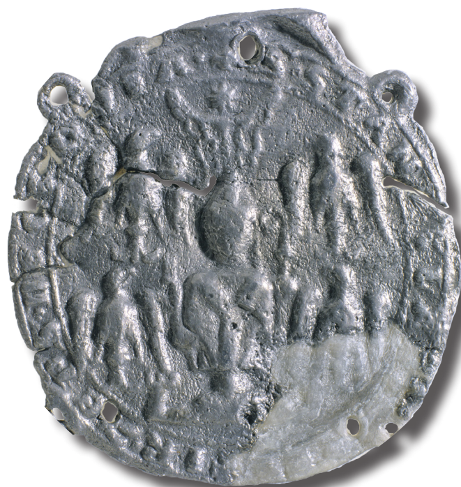
Znak pielgrzymi z wizerunkiem św. Stanisława

Tym samym katedra wpisała się w wielowiekową sieć średniowiecznych szlaków pielgrzymkowych.