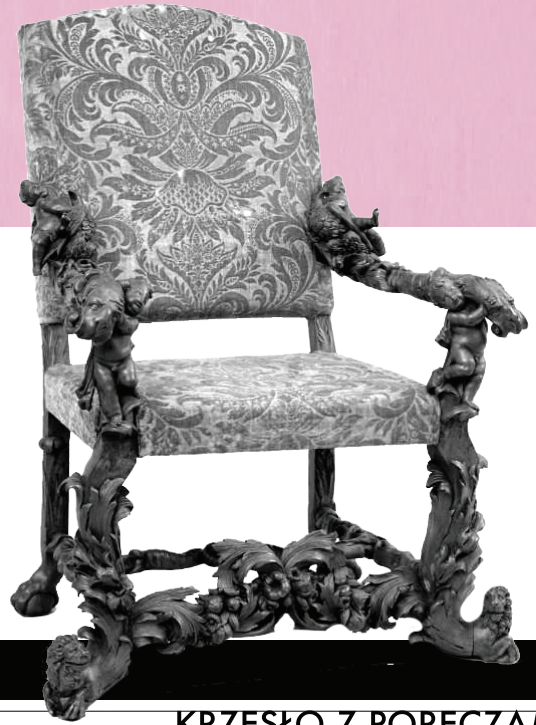
KRZESŁO Z PORECZAMI, WŁOCHY, 1. CWIERC XVIII W.