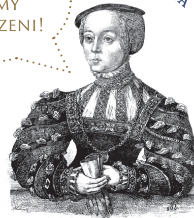
Portret Elżbiety Habsburżanki wg Cranacha, Karol Wawrosz, 1908

waga: około 13 kg wysokość: 157 cm Kto wykonał? Jörg Seusenhofer Kiedy? 1533 Gdzie? Innsbruck (Austria)