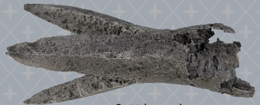
Grot tak zwany koronny

Na dziedzińcu zamku królewskiego na Wawelu archeolodzy znaleźli groty do kopii turniejowych