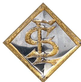
Pierwsze litery imion Elżbieta i Zygmunt (Elisabeth i Sigismundus po łacinie)

Zygmunt August dostał zbroję od Ferdynanda Habsburga, jako prezent z okazji swoich zaręczyn z jego córką Elżbietą. Ile lat miał Zygmunt, kiedy otrzymał prezent zaręczynowy?