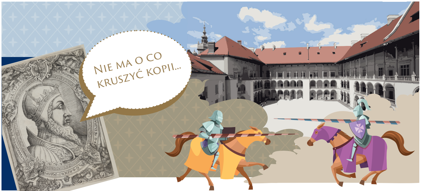
Portret Zygmunta Augusta, Solis Vergilius, 1554