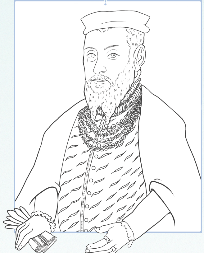
ZYGMUNT II AUGUST