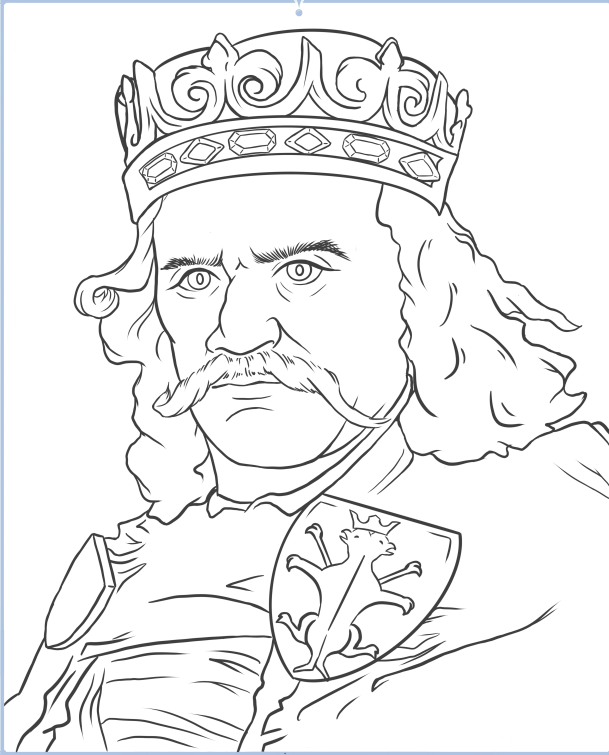
WŁADYSŁAW I ŁOKIETEK