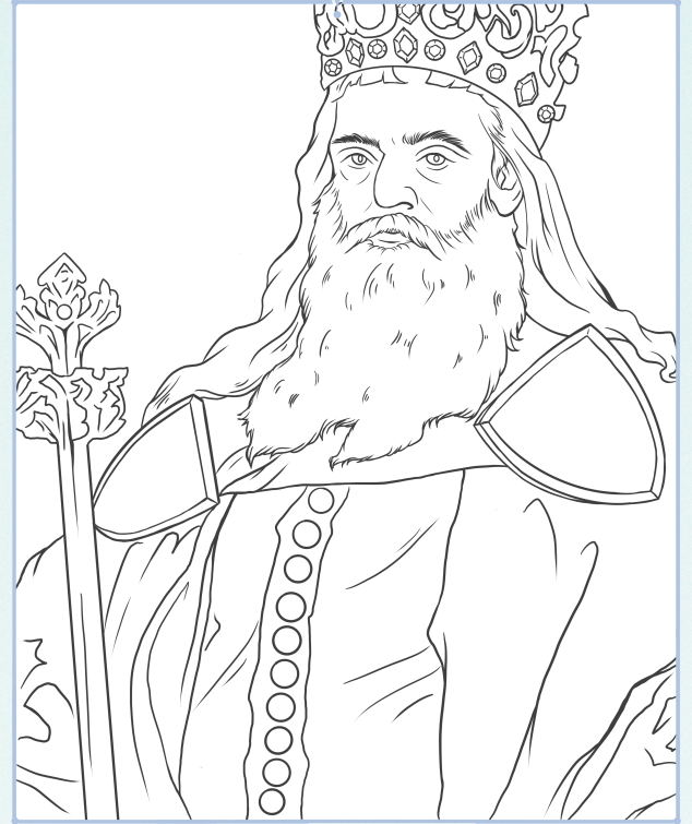
KAZIMIERZ III WIELKI