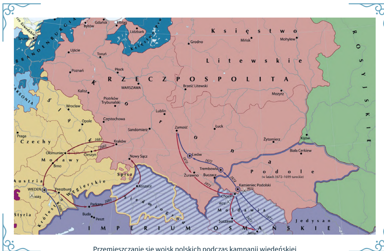
Przemieszczanie się wojsk polskich podczas kampanii wiedeńskiej

W marcu 1683 roku Turcy rozpoczęli wojnę z Austrią. Armia pod wodzą wielkiego wezyra Kara Mustafy już 10 lipca stanęła pod murami Wiednia. Do króla Jana III Sobieskiego przybył poseł austriacki z prośbą o szybką pomoc. Związany sojuszem z cesarzem Leopoldem I polski monarcha zarządził koncentrację wojsk pod Krakowem. Dwadzieścia siedem tysięcy wojsk koronnych w sierpniu wyruszyło na odsiecz Wiedniowi. Trasa marszu prowadziła przez Śląsk, Morawy i Czechy. 3 września wojska polskie połączyły się z oddziałami sprzymierzonych niedaleko stolicy Cesarstwa. Dowództwo nad sześćdziesięciosiedmiotysięczną armią powierzono królowi Polski.