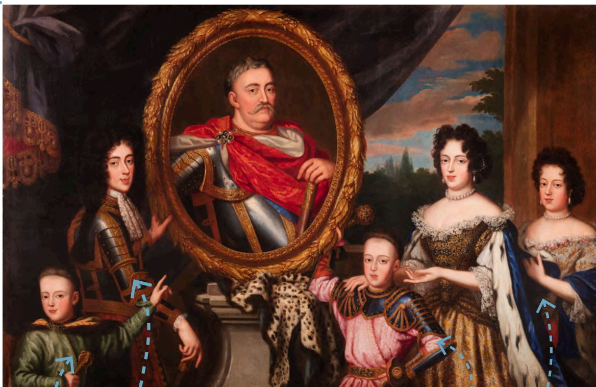
Henri Gascar (1635–1701), Portret rodziny króla Jana III Sobieskiego, 1691

Obraz przedstawiający członków rodziny Sobieskich został namalowany przez Henriego Gascara w 1691 roku. Wokół króla, przedstawionego jako rycerz w złoczonej zbroi, gromadzą się najbliżsi członkowie rodziny. Ramę z wizerunkiem ojca podtrzymują dwaj starsi synowie. W lewym rogu najmłodszy z synów wskazuje palcem na głowę rodziny. Po przeciwnej stronie zostały przedstawione: królowa w płaszczu podbitym gronostajowym futrem i stojąca za nią jedyna córka pary królewskiej.