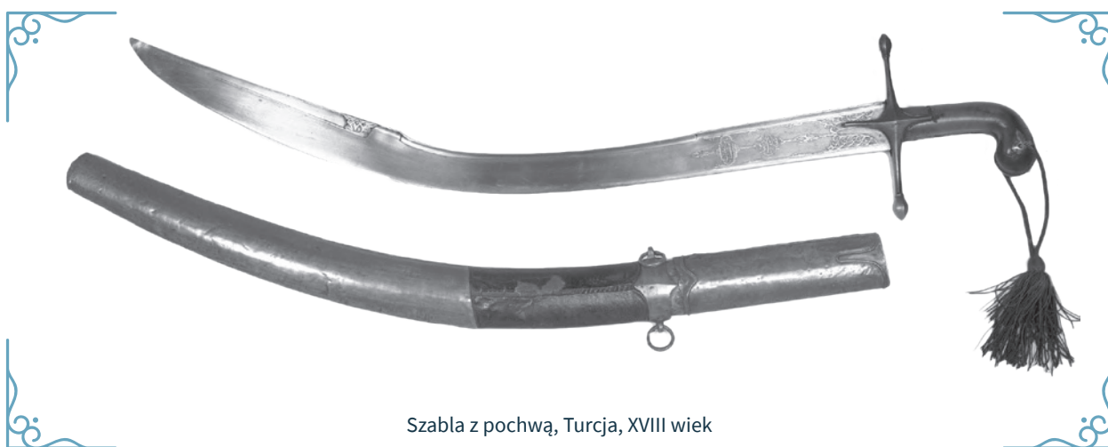
Szabla z pochwą, Turcja, XVIII wiek

Szabla to broń sieczna o łukowato zagiętej głowni, którą władano już w starożytnej Persji. W czasach średniowiecznych i nowożytnych używano jej powszechnie na Bliskim Wschodzie. W drugiej połowie XVI wieku, zastępując miecz, wprowadzono ją do stałego wyposażenia polskiej jazdy. W znacznym stopniu do rozpowszechnienia szabli przyczyniły się walki z Turkami i Tatarami, którzy używali właśnie tego typu broni. Z czasem wykształcił się polski typ paradnej szabli zwanej karabelą.