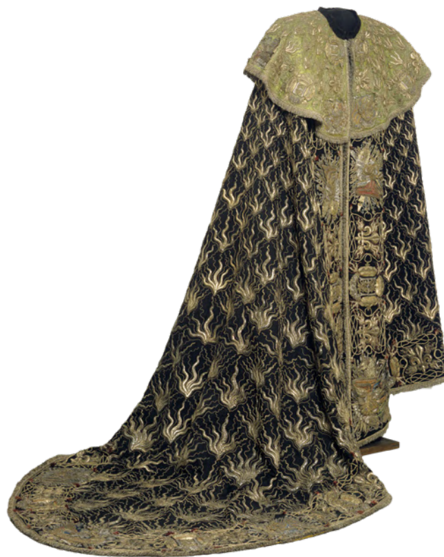
Płaszcz Kawalera Orderu Świętego Ducha, Paryż, 1675-1676