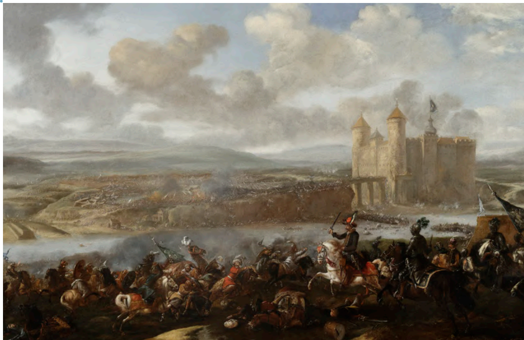
Jan van Huchtenburg (1647–1733), Bitwa pod Chocimiem , Holandia, 4. ćwierć XVII wieku

Dzięki odrzuceniu przez sejm hańbiącego traktatu w Buczaczu i uchwaleniu podatków, Jan Sobieski poprowadził przeciwko Turcji nową armię. Bitwa pod Chocimiem w 1673 roku stała się największym zwycięstwem odniesionym nad Turkami przez wojska polskie. Dzięki doświadczeniu i taktyce hetmana Jana Sobieskiego, między innymi przetrzymaniu w gotowości bojowej przez zimną noc wrażliwego na chłody wojska tureckiego, rozbito trzydziestopięciotysięczną armię osmańską. Zwycięstwo to otworzyło hetmanowi drogę do korony królewskiej po zmarłym na dzień przed bitwą Michale Korybucie Wiśniowieckim.