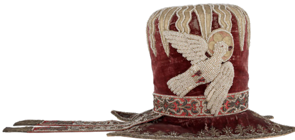
Kapelusz poświęcony króla Jana III Sobieskiego z daru Innocentego XI, Rzym, 1676–1677

Zespół szczególnych eksponatów związanych z osobą królewską znajduje się w Skarbcu Koronnym na Wawelu. Tworzą one grupę pamiątek rodowych przechowywanych kiedyś w rezydencji Sobieskich w Żółtkwi. Wśród nich wyróżnia się czarny aksamitny płaszcz Kawalera Orderu Świętego Ducha, który wraz łańcuchem i zawieszonym na nim krzyżem został przekazany Janowi III przez króla Francji Ludwika XIV w 1676 roku (zachował się tylko płaszcz). W tej samej gablocie możemy także zobaczyć połączony miecz poświęcony z pochwą i pasem oraz kapeluszem, ofiarowanymi królowi przez papieża Innocentego XI w rok po odsieczy Wiednia za zasługi dla obrony wiary chrześcijańskiej.