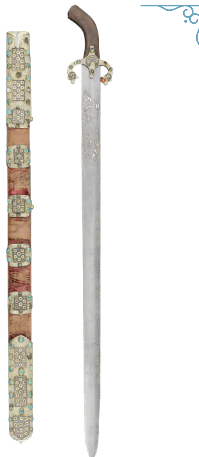
Pałasz z pochwą po Krzysztofie Leopoldzie Schaffgotschu, Turcja, XVII wiek (wtórnie użyta głownia perska z XVI wieku)