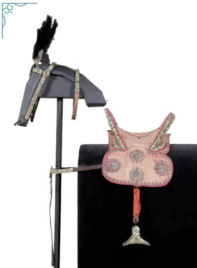
Siodło ze strzemionami po Krzysztofie Leopoldzie Schaffgotschu, ambasadorze cesarskim przy Janie III Sobieskim, Turcja, przed 1683

Barwom przypisywano znaczenie symboliczne. Purpura była kolorem przynależnym władcom. Wielką popularnością cieszyły się drogocenne kamienie, które miały przynosić szczęście. Nefryty, turkusy czy agaty zdobiły broń i paradne rzędy końskie, a na militariach umieszczano inskrypcje z Koranu, wierząc, że mają magiczną moc i gwarantują zwycięstwo.