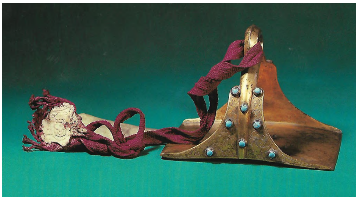
Strzemień wezyra Kara Mustafy, Turcja, XVII wiek, skarbiec katedry na Wawelu

Bóg i Pan nasz na wieki błogosławiony dał zwycięstwo i sławę narodowi naszemu, o jakiej wieki przeszłe nigdy nie słyszały. Działa wszystkie, dostatki nieoszacowane dostały się w ręce nasze.