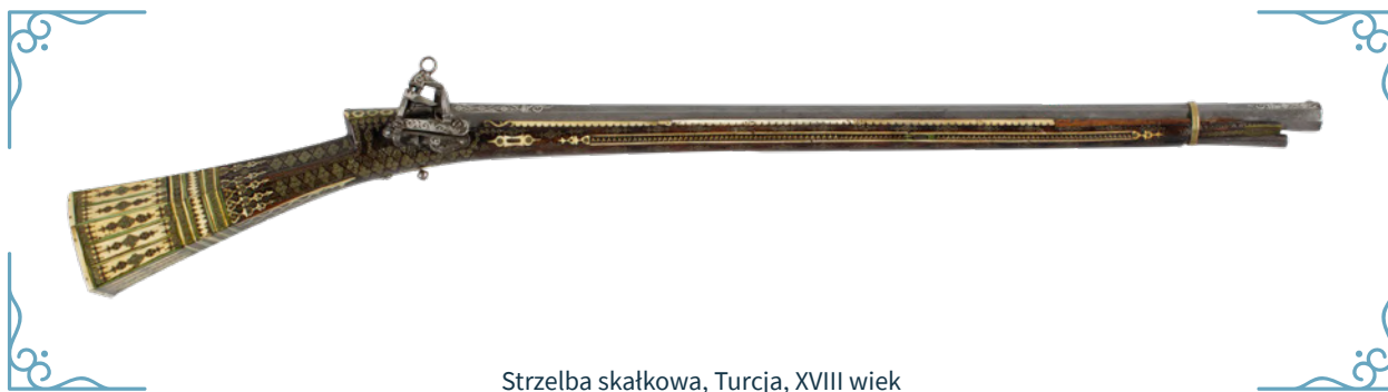
Strzelba skałkowa, Turcja, XVIII wiek

Drugą najważniejszą formacją armii tureckiej byli spahisi – ciężka jazda stanowiąca odpowiednik europejskiego rycerstwa. Ubrani byli w kolcze pancerze zwane bechterami i juszmanami lub zbroje typu zwierciadlanego. Ich głowy chroniły szyszaki albo misiurki, będące rodzajem hełmu pochodzenia wschodniego. W trakcie walki posługiwali się ciężką szablą, buzdyganem i spisą używaną podczas szarży do zadawania ciosów długim ostrzem. Ich osłonę stanowiła okrągła tarcza zwana kałkanem.