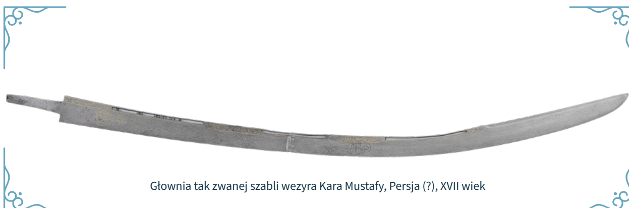
Głownia tak zwanej szabli wezyra Kara Mustafy, Persja (?), XVII wiek

Jednym z najważniejszych trofeów przywiezionych spod Wiednia jest znajdująca się w wawelskich zbiorach głownia szabli, którą dziewiętnastowieczna tradycja łączy z wielkim wezyrem Kara Mustafą i odsieczą wiedeńską. Złożona została przez króla wraz z turecką chorągwią inskrypcyjną w Loreto – słynnym sanktuarium maryjnym. W 1798 roku wręczono ją w Rzymie na Kapitolu twórcy Legionów Polskich we Włoszech generałowi Janowi Henrykowi Dąbrowskiemu. Za pośrednictwem generała Karola Kniaziewicza przekazano ją w Paryżu na ręce Tadeusza Kościuszki. W późniejszych latach znajdowała się w zbiorach rodziny Sapiehów w Krasicy. W latach pięćdziesiątych XX wieku szabla wzbogaciła kolekcję wiedeńskich trofeów wawelskiego zamku.