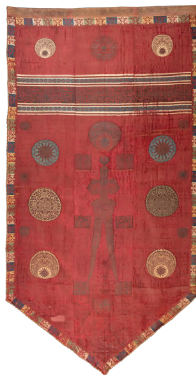
Chorągiew typu zulfiqarowego, Stambuł lub Bagdad (?), 1. połowa XVII wieku