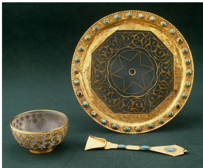
Czarka, paterka, łyżeczka, Turcja, 2. połowa XVII wieku