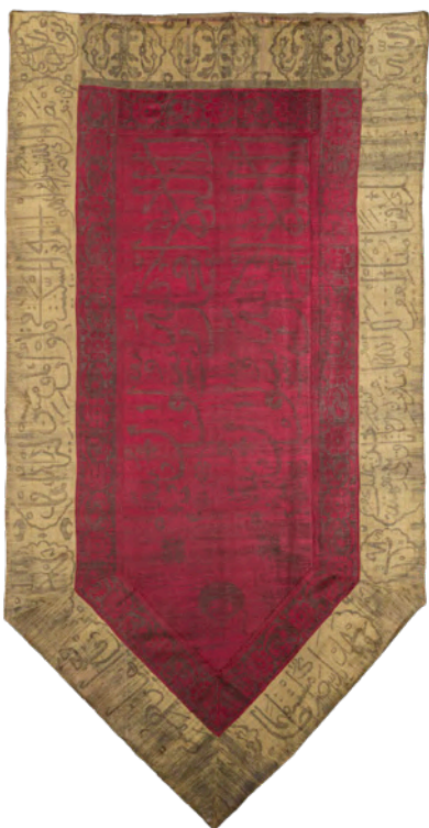
Chorągiew typu inskrypcyjnego, Stambuł (?), 1. połowa XVII wieku