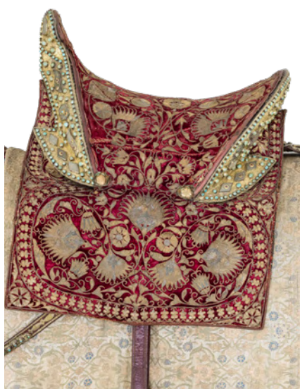
Siodło, Turcja, 2. połowa XVII wieku

W 1684 roku państwa walczące przeciwko Turcji podpisały traktat, powołując Ligę Świętą. W jej skład weszła Rzeczpospolita, Austria, Wenecja oraz papieństwo. Wojna z Turcją zakończyła się trzy lata po śmierci Jana III Sobieskiego. W 1699 roku, za czasów panowania Augusta II Sasa, podpisano pokój w Karłowicach. Zachowały się czarka, paterka i łyżeczka z nefrytu oraz siodło ofiarowane przez sułtana Mustafę II posłowi Stanisławowi Małachowskiemu, reprezentującemu polskiego władcę. Na mocy pokojowych postanowień Polska odzyskała prawobrzeżną Ukrainę i Podole z Kamieńcem Podolskim.