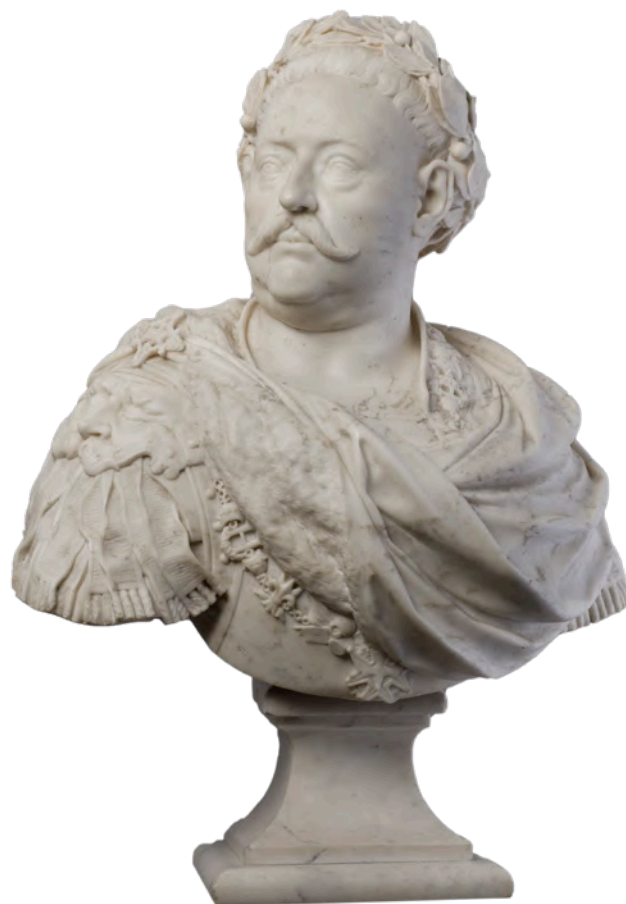
Giacomo Monaldi (1730–1798), Popiersie Jana III Sobieskiego, około 1783

J an III Sobieski, herbu Janina, urodził się w 1629 roku w Olesku. Ojcem przyszłego króla był Jakub Sobieski – wszechstronnie wykształcony magnat, poseł słynący ze wspaniałych publicznych przemówień, a także waleczny dowódca pozostający w służbie królów Zygmunta III Wazy i Władysława IV. Matka Jana, Teofila Zofia z Daniłowiczów, będąca wnuczką słynnego hetmana, miała wielki wpływ na wychowanie syna. Jego osobowość i męstwo kształtował dom pełen pamiątek i wspomnień po wielkim pradziadku, hetmanie znanym z kampanii moskiewskiej i zwycięstwa w bitwie pod Kłuszynem w 1610 roku. Śmierć tego przywódcy podczas odwrotu wojsk koronnych w bitwie z turecko-tatarską armią dała początek późniejszej legendzie powiązanej z narodzinami Jana Sobieskiego. Kiedy małego chłopca położono na kamiennej trumnie przodka, ta pękła i dobył się z niej głos: „Z naszych kości powstał mściciel”.