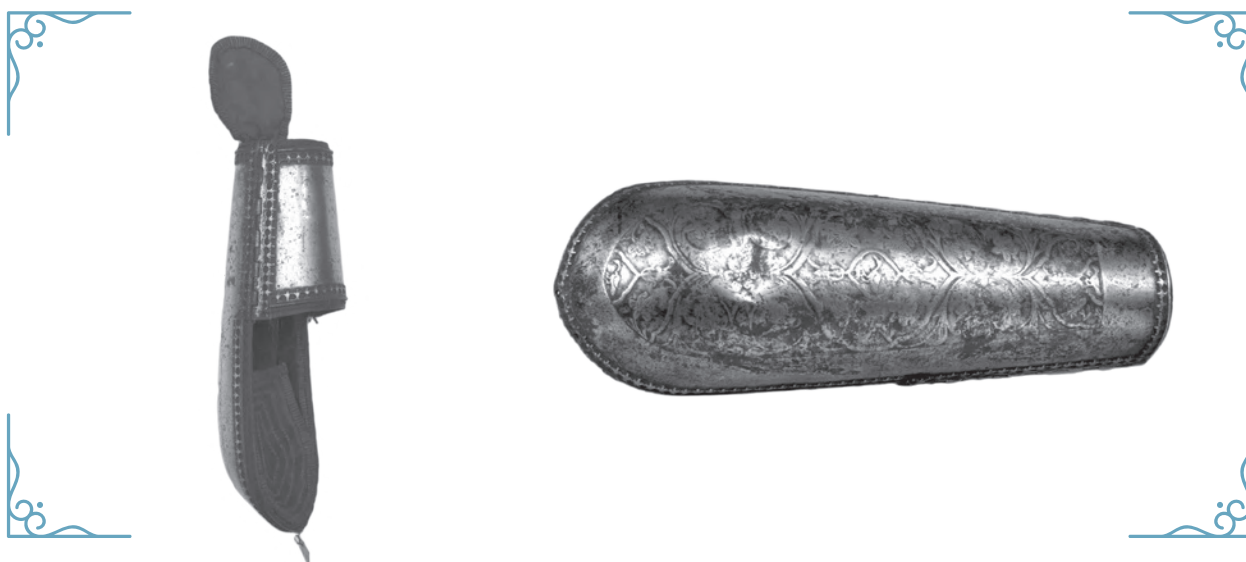
Para karwaszy, Turcja, XVII wiek

Drugą najważniejszą formacją armii tureckiej byli spahisi – ciężka jazda stanowiąca odpowiednik europejskiego rycerstwa. Ubrani byli w kolcze pancerze zwane bechterami i juszmanami lub zbroje typu zwierciadlanego. Ich głowy chroniły szyszaki albo misiurki, będące rodzajem hełmu pochodzenia wschodniego. W trakcie walki posługiwali się ciężką szablą, buzdyganem i spisą używaną podczas szarży do zadawania ciosów długim ostrzem. Ich osłonę stanowiła okrągła tarcza zwana kałkanem.