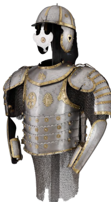
Półbroja husarska, Polska, 2. połowa XVII wieku