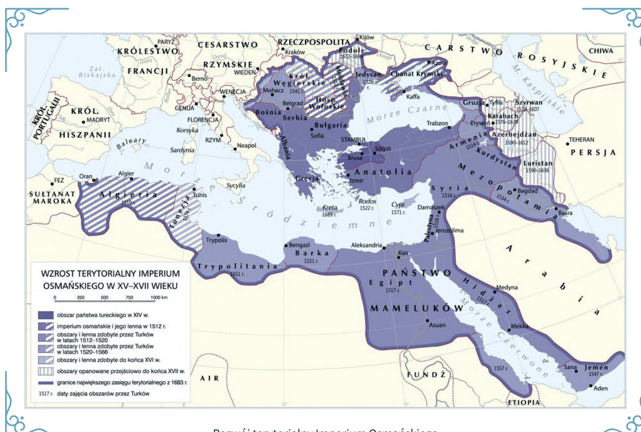
Rozwój terytorialny Imperium Osmańskiego

Rok po abdykacji Jana Kazimierza (1668), podczas wolnej elekcji, szlachta wybrała na króla Michała Korybuta Wiśniowieckiego. Jan Sobieski, popierający innego kandydata – Ludwika Burbona zwanego Kondeuszem Wielkim, odmówił złożenia przysięgi nowemu władcy, nie podpisując aktu elekcji. Tym samym dołączył do stronnictwa dążącego do detronizacji nowo obranego króla. Trzy lata później na ziemie polskie wkroczyła stutysięczna armia turecka, zajmując Kamieniec Podolski – twierdzę zwaną „kluczem do Podola”. Jej utrata była jednym z powodów podpisania traktatu z Imperium Osmańskim, nazwanego „haniebnym pokojem w Buczaczu”. Rzeczpospolita straciła Podole i zobowiązała się do wypłaty rocznego haraczu w wysokości 22 tysięcy czerwonych złotych w zamian za pokój.