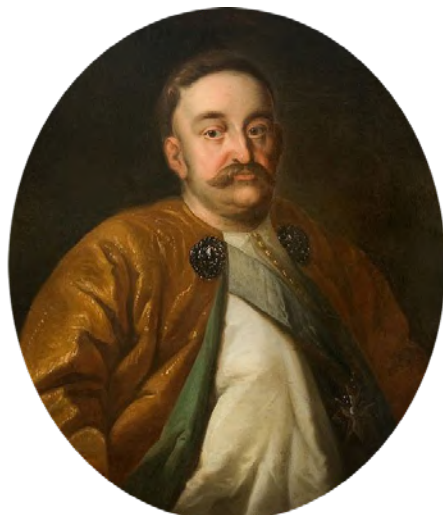
Prosper Henricus Lankrink (1628–1692), Portret Jana III Sobieskiego, po 1676