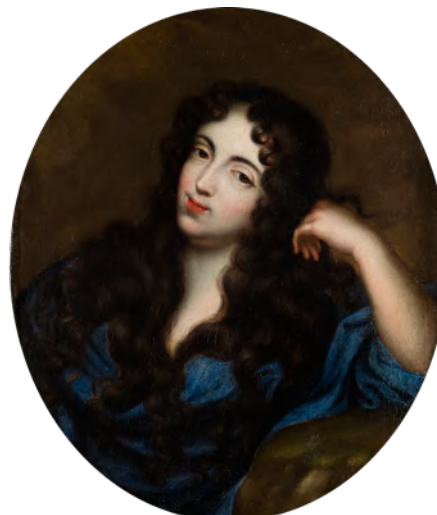
Malarz nieokreślony, Portret Marii Kazimiery d'Arquien, 3. ćwierć XVII wieku

M aria Kazimiera d'Arquien była jedną z ulubionych dwórek królowej Ludwiki Marii Gonzagi. W 1655 roku Jan Sobieski poznał ją na jednej z zabaw na dworze Jana Kazimierza. Słynąca z wyjątkowej urody czternastoletnia dwórka wzbudziła zachwyt chorążego koronnego, który miał wówczas 26 lat. Niestety, zamożny magnat, Jan Sobiepan Zamojski, ubiegł go w staraniach o rękę ulubienicy królowej. Uczucie młodych kochanków jednak przetrwało. Dowodem tego są liczne listy pisane w ciągu dziesięciu lat, w których oboje stworzyli własny szyfr miłosny. On nazywał ją Astreą, Jutrzenką, Różą bądź Bukietem, a ona, skrywając jego imię, określała go Celadonem, Sylwandrem, Prochem. Krótco po śmierci Jana Zamojskiego w 1665 roku Jan Sobieski poślubił swą wielką miłość.