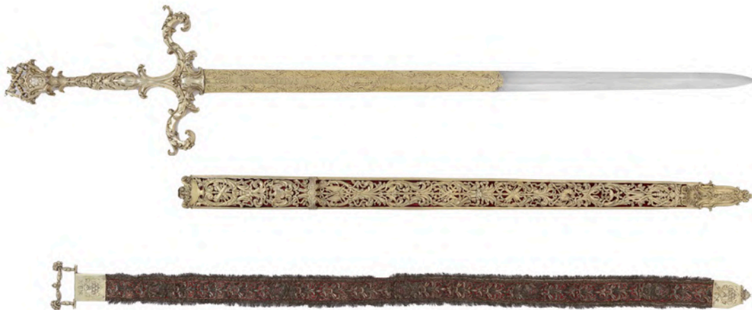
Miecz, pochwa, pas poświęcane króla Jana III Sobieskiego z daru Innocentego XI, Rzym, 1674 i 1676