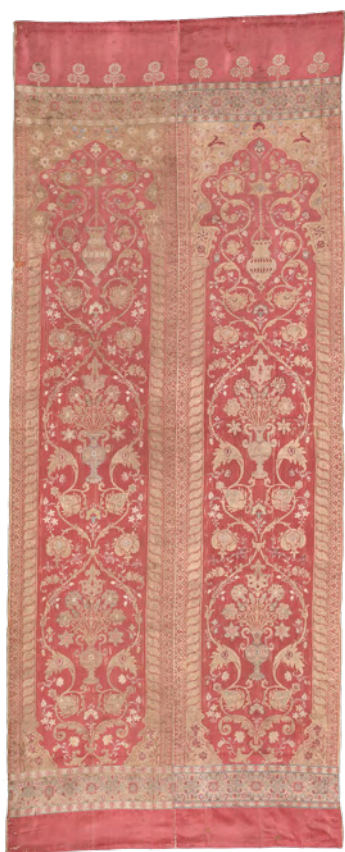
Makata arkadowa, Turcja, XVIII wiek

Wśród licznych trofeów przywiezionych do Krakowa znajdowały się wschodnie kobierce i makaty. Tkane już w czasach starożytnych, w Polsce od XIV stulecia cieszyły się wielką popularnością. Kobierce z bawełny, wełny lub jedwabiu służyły do spania, siedzenia, ozdabiania wnętrz i odprawiania modlitw. Jedwabne makaty przetykane srebrem i złotem ozdabiały nie tylko pałacowe komnaty, ale także wnętrza namiotów.