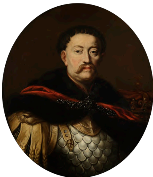
Malarz nieokreślony, Król Jan III w zbroi karacenowej , około 1675

Na zdjęciu widzisz portret Jana III Sobieskiego w typowej półbroi husarskiej. Spróbuj odszukać w tekście, jak nazywano zbroję, w której przedstawiani byli w sztuce cesarze rzymscy.