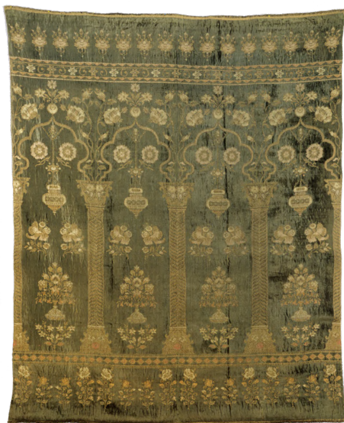
Makata arkadowa, Persja, XVII/XVIII wiek