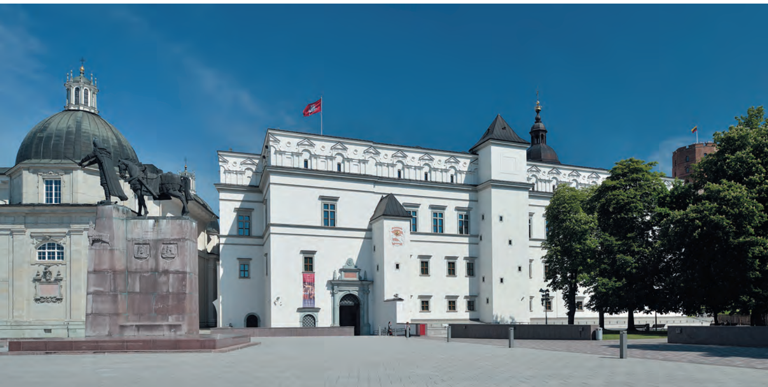
Fot. Vyrautas Abramauskas

Zamek Królewski na Wawelu ma niezwykłą możliwość pokazania polskiej publiczności arrasu herbowego króla i wielkiego księcia Zygmunta Augusta (1520–1572), pochodzącego z kolekcji Pałacu Wielkich Książąt Litewskich w Wilnie. Wystawa wypożyczonej z Wilna tapiserii uświetni odbywające się w Krakowie Dni Litwy. Ta niewielka tkanina została wykonana prawdopodobnie około połowy w. XVI w nieokreślonym warsztacie we Flandrii, na terenie dzisiejszej Belgii.