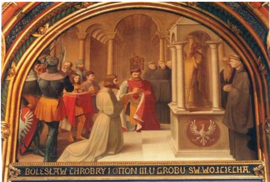
Edward Brzozowski „Bolesław Chrobry i Otton III u grobu św. Wojciecha” w Złotej Kaplicy w katedrze poznańskiej

Po ogłoszeniu Wojciecha świętym do jego grobu udał się cesarz Otton III . Jego wizytę tak opisał kronikarz Gall Anonim: