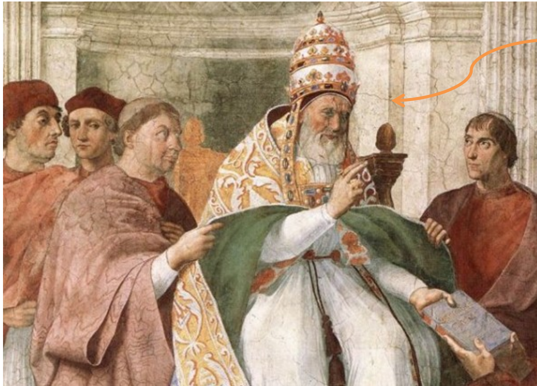
Rafaello Santi, fragment fresku przedstawiający Grzegorza IX

W 1234 roku papież Grzegorz IX ogłosił, że przypadek każdego potencjalnego świętego musi zostać dokładnie zbadany przez głowę Kościoła.