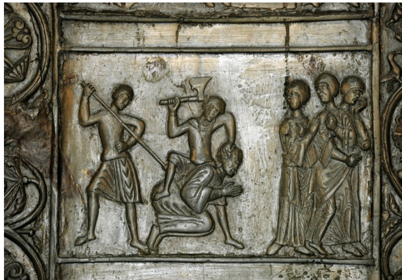
Męczeństwo św. Wojciecha, scena XIV Drzwi Gnieźnieńskich (II poł. XII w.)

przyrodnim bratem św. Wojciecha był Radzim Gaudenty – pierwszy arcybiskup gnieźnieński?