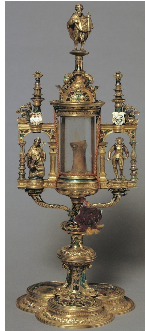
Relikwiarz św. Zygmunta, Norymberga, 1533; złoto, kryształ górski; odlewanie, cyzelowanie, emalia; wysokość 27 cm; Kraków, skarbiec katedry na Wawelu