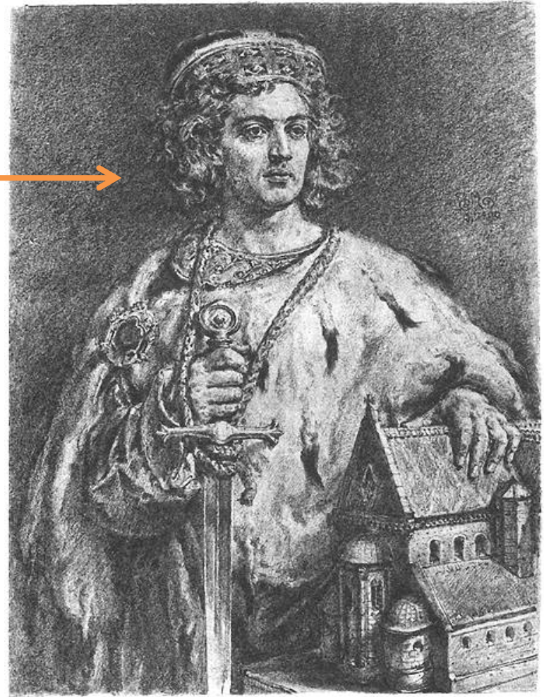
J. Matejko, Bolesław IV Kędzierzawy